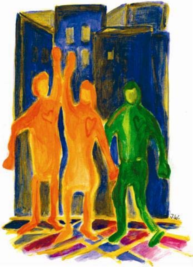
Illustration: Jeanette Wahl