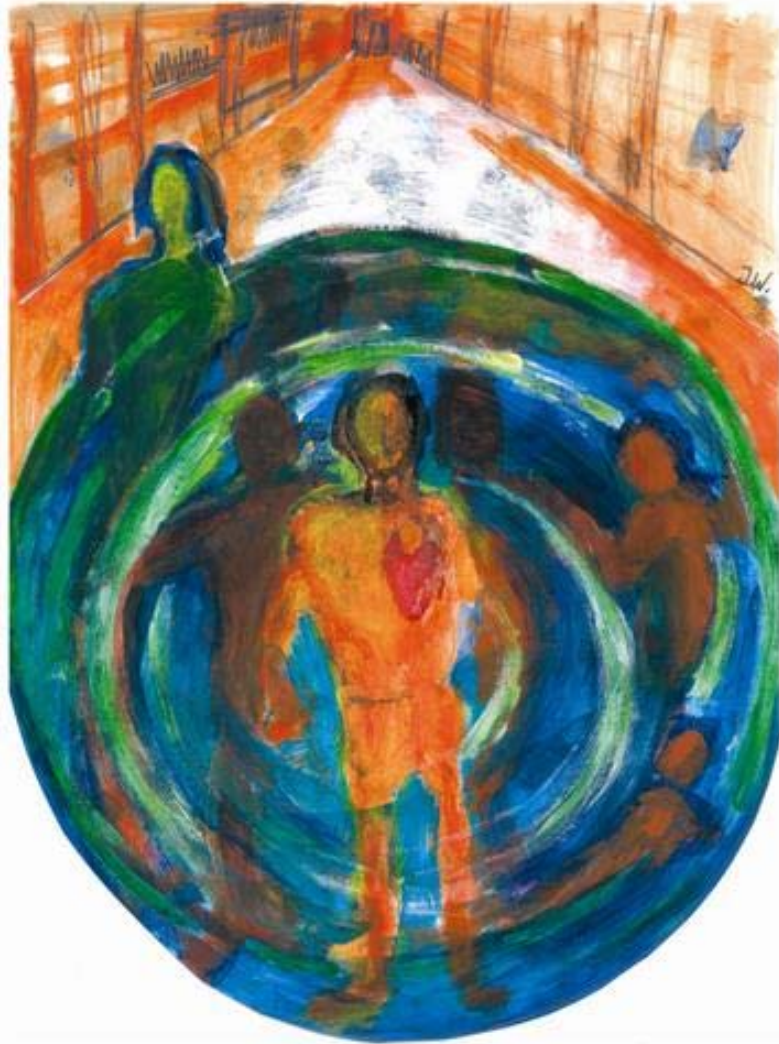
Illustration: Jeanette Wahl